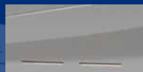
Seitliche Steckplätze für SMC-Karten