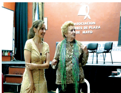
Madres de Plaza de Mayo

Der Rest des Tages steht Ihnen zur freien Verfügung. Entdecken Sie die Stadt auf eigene Faust und genießen Sie die besondere Atmosphäre.