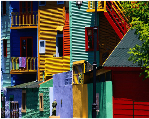
La Boca