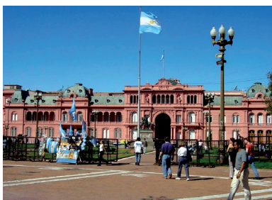
Casa Rosada