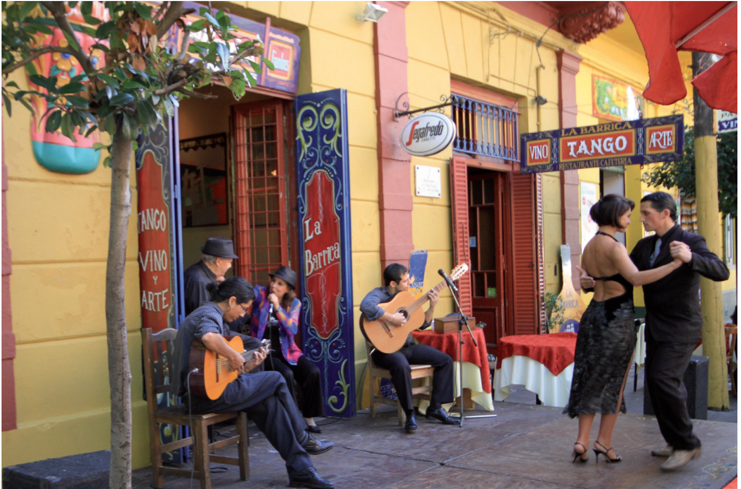
Tango Argentino

Psychotherapie und die Leidenschaft des Tango Argentino